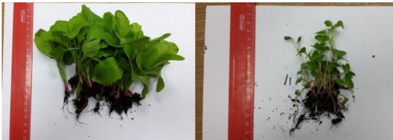
Рис. 2. Контрольная проба G11 (слева) и проба G05 (справа)

Растения контрольной группы (проба G11) на момент сбора (20-й день со дня посадки) также не достигли периода созревания, а достигли ювениального этапа развития, но их масса существенно превышала массу проб, высаженных в естественный грунт. На рис. 2 представлены для сравнения контрольная проба и проба, выросшая на исследуемой урбанизированной территории. Измеренные сырая и сухая массы проб биоматериала приведены в табл. 1