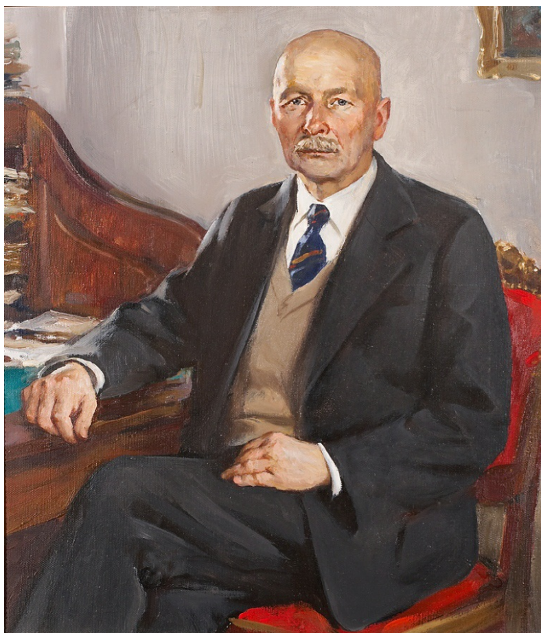
Рис. 3. Николай Николаевич Калитин