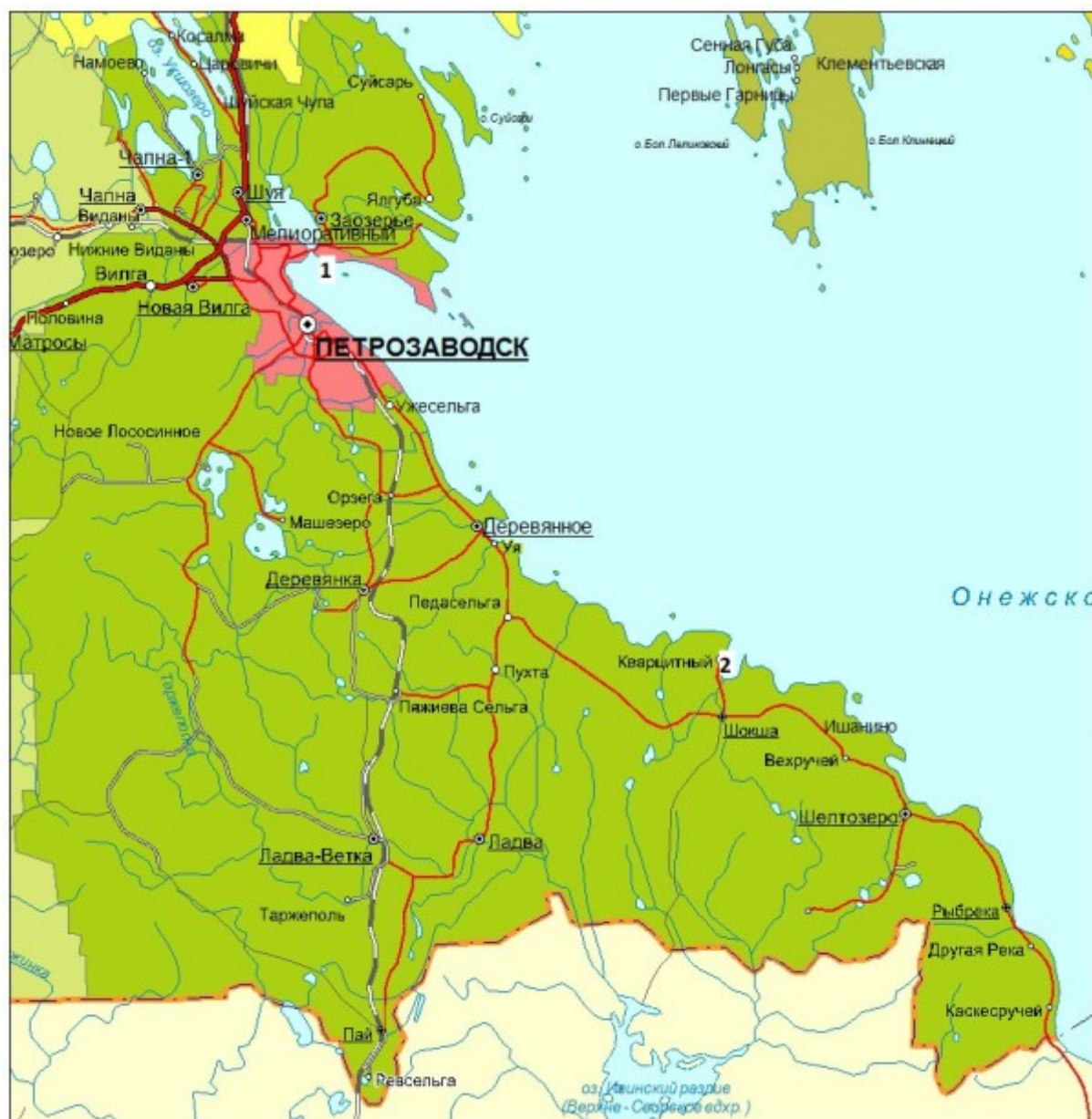
Рис. 1. Карта Республики Карелия. 1 – Ботанический сад ПетрГУ (место исследования – урочище Чертов Стул), 2 – пос. Кварцитный (место исследования – кварцитный карьер) Fig. 1. The map of the Republic of Karelia. 1 – The Botanical garden of PetrSU (the place of studying - the Devil's Chair tract), 2 – vil. Kvarcitsnyy (the place of studying - waste crimson quartzite quarry)

В естественных условиях обитания исследованных видов были оценены параметры среды: тип растительного сообщества, угол наклона поверхности субстрата и экспозиция склона (с помощью горного компаса). Измеренные параметры среды отражают световое довольствие местообитания.