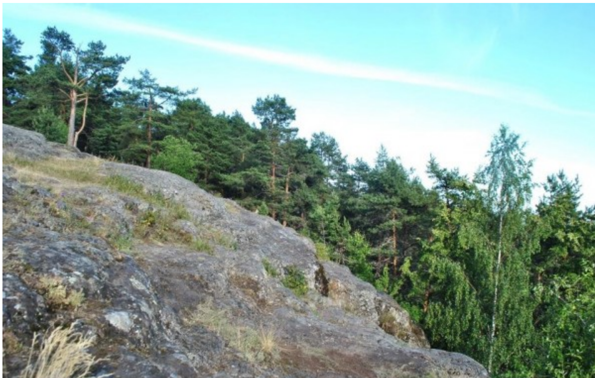
Рис. 2. Общий вид урочища «Чертов Стул», Петрозаводский городской округ. Fig. 2. General view of the Devil's Chair tract in Petrozavodsk urban district.

Вторым местом отбора образцов был заброшенный карьер в пос. Кварцитный. Добыча малинового кварцита здесь была завершена в 30-х годах XX века. Образцы собраны с более или менее горизонтальных скальных поверхностей (угол наклона от +48^\circ до +85^\circ ) с большой давностью нарушения, на самом верху карьера, вблизи сосняка черничного зеленомошного. Скалы не затенены лесом, имеют южную экспозицию. Виды U. deusta и U. hyperborea произрастают в практически одинаковых условиях, образуя скопления талломов на одном и том же скальном выступе (рис. 3).