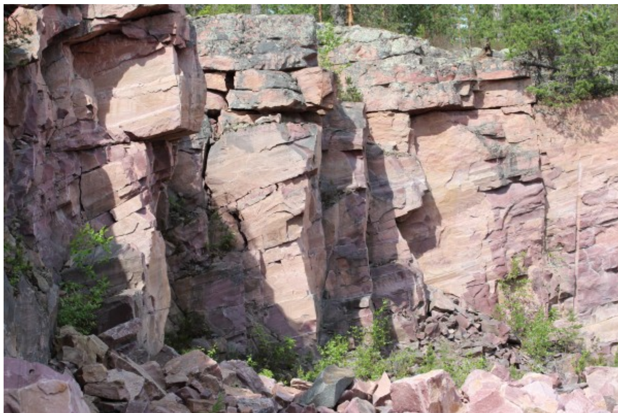
Рис. 3. Общий вид кварцитового карьера, п. Кварцитный, Прионежский административный район. Fig. 3. General view of the crimson quartzite quarry in vil. Kvarcitsitny of Prionezhsky region.

Всего было собрано 8 образцов талломов лишайников (в каждом по 10-20 талломов): 4 образца в кварцитовом карьере (2 - U. deusta , 2 - U. hyperborea ) и 4 образца в пределах урочища «Чертов Стул» (3 - U. deusta , 1 - U. hyperborea ).