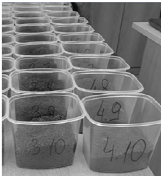
Рис. 1. Образцы нефтезагрязненной почвы Fig. 1. Samples of oil-contaminated soil

В качестве поверхностно-активных веществ при проведении исследований использовались два вещества, применяемых для промывки почвы, загрязненной нефтью: гидробрейк и рифей.