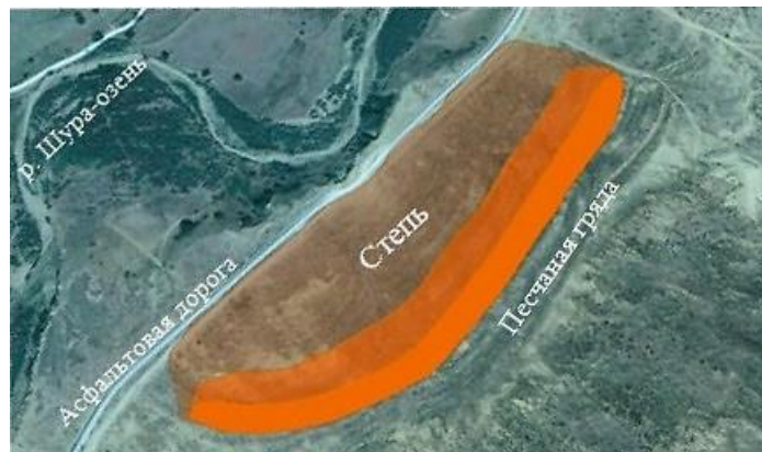
Рис. 6. Участки, прилегающие к малому Сарыкумскому бархану, использованные нами в расчете численности популяции разноцветных ящурок. Участок плотного проживания разноцветных ящурок отмечен на рисунке ярко-красным цветом (учетная полоса) и средне-прозрачным розовым цветом; самым прозрачным розовым цветом показан участок до асфальтовой дороги, на котором ящурки встречаются, но плотности их обитания на нем ниже, чем на двух предыдущих, и к тому же распределение ящурок на нем неравномерное. Рисунок построен с применением программы Google Earth

Для учета численности разноцветных ящурок мы использовали следующий прием. Три человека просматривали полосу степи шириной 35–40 м (примерно по 10–15 м на человека), длина этого учетного маршрута составляла 800 м. Площадь просматриваемой территории оказалась примерно 30000 м 2 , т. е. 3 га (см. рис. 6).