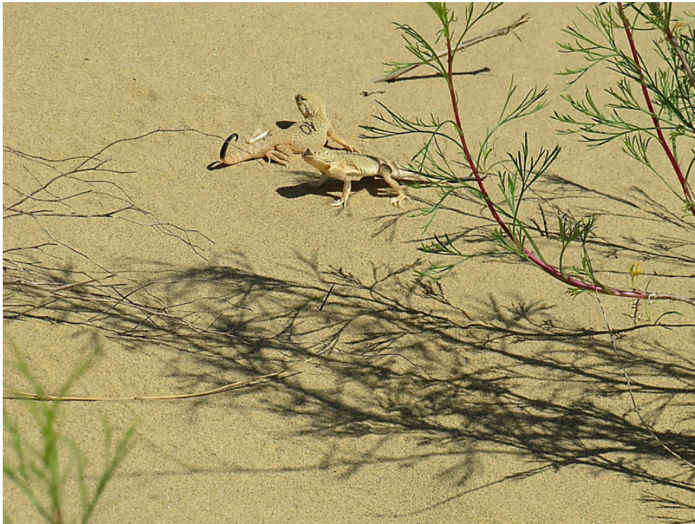
Рис. 2. Ушастая круглоголовка, помеченная номером Fig. 2. Toad-headed agama marked with a number

Важно определенным образом учитывать неравномерность распределения животных по изучаемой территории (Коли, 1979). В нашем случае ушастые круглоголовки распределяются по бархану в соответствии с типами биотопов. Прежде всего они избегают заросших травой участков. Но на бархане имеется некоторое количество различающихся биотопов, на которых круглоголовки наиболее часто встречаются: это открытые, развеваемые песчаные территории, также активно используются участки, слабо заросшие такими растениями, как, например, волоснец кистистый ( Leymus racemosus ), жузгун безлистный ( Calligonum aphyllum ) и др. Учитывая это обстоятельство, мы разбили территорию бархана на зоны, внутри которых плотность населения круглоголовков примерно одинакова. Согласно рекомендациям Г. Коли (1979), это соответствует методическому процессу стратификации, а выделенные однородные зоны можно назвать стратами.