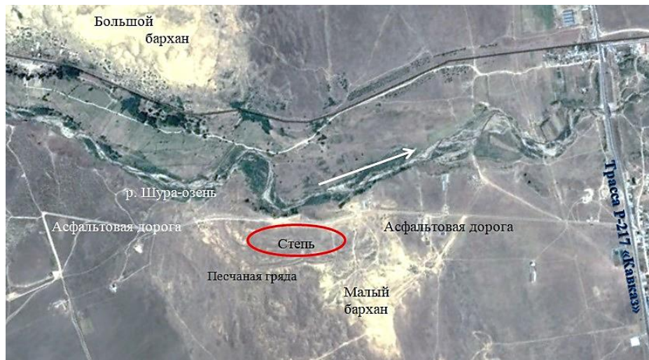
Рис. 5. Участок территории около малого Сарыкумского бархана, на котором мы изучали разноцветную ящурку (в красном овале). Белая стрелка показывает направление течения реки. Рисунок построен с применением программы Google Earth Fig. 5. The plot of territory near the small Sarykum dune, where we studied the stepperunners (in a red oval). The white arrow shows the direction of the river flow. The drawing is built using the Google Earth program

Почва в степи, населенной разноцветными ящурками, глинистая с мелкой травянистой растительностью. В качестве убежищ ящурки использовали в основном кусты полыни с жесткими стволиками, откуда их было очень трудно достать. В такие кусты ящурки скрывались при приближении опасности, прячась между твердыми стеблями. Внутри этих кустов часто располагались их собственные норы длиной около 20–25 см и глубиной залегания примерно 5 см. В некоторых случаях мы видели отдельные норы ящурок, расположенные на открытых местах вне кустов.