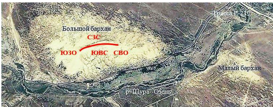
Рис. 1. Расположение большого и малого Сарыкумских барханов и схема большого Сарыкумского бархана и его окрестностей. Красной полосой отмечен гребень большого бархана между двумя его высшими точками. СВО – северо-восточная оконечность бархана, ЮЗО – юго-западная оконечность бархана, ЮВС – юго-восточный склон бархана, СЗС – северо-западный склон бархана. Рисунок построен с применением программы Google Earth

Итак, для оценки состояния популяции ушастой круглоголовки мы выбрали изолированную популяцию большого Сарыкумского бархана. Ранее круглоголовки населяли и малый бархан, но сейчас они там не встречаются (рис. 1).