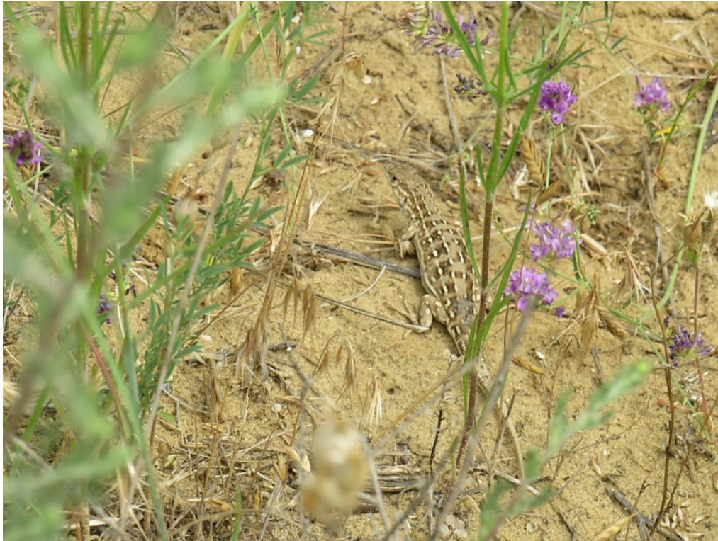
Рис. 4. Разноцветная ящурка на малом Сарыкумском бархане Fig. 4. The stepperunner on the small Sarykum dune