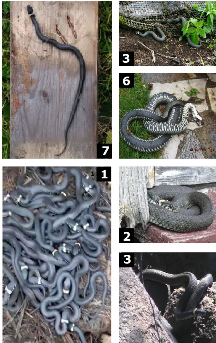
Рис. 2. Фотографии ужей из разных мест Карелии (приведены номера точек из таблицы)