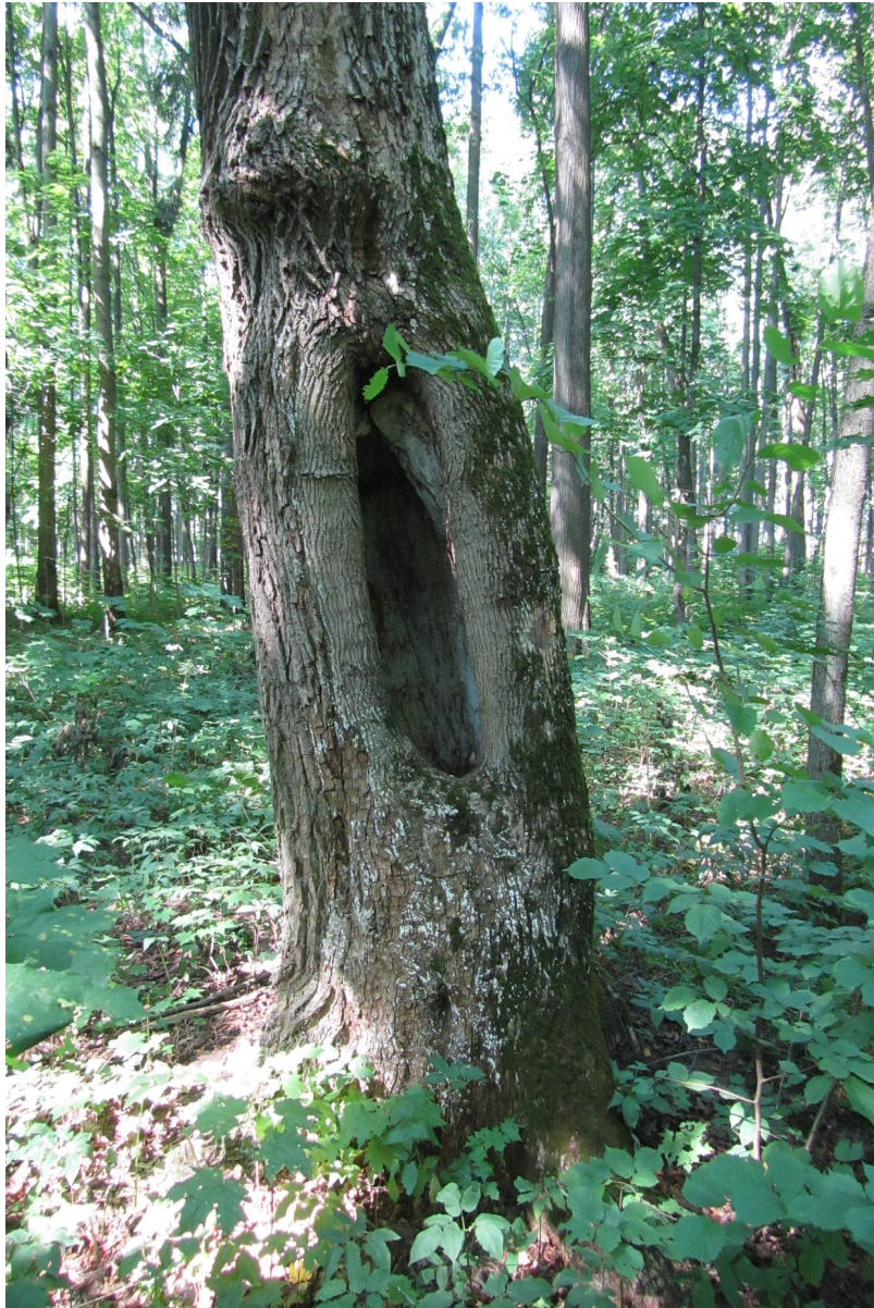
Рис. 5. Дерево клена с наклоном ствола и обширным дуплом Fig. 5. Maple tree with the slope of the trunk and a large hollow

Несмотря на то, что многие деревья имели в стволе развитую ядровую гниль, состояние их кроны (ассимиляционного аппарата) было очень хорошим, примером чему служит дерево, изображенное на рис. 6.