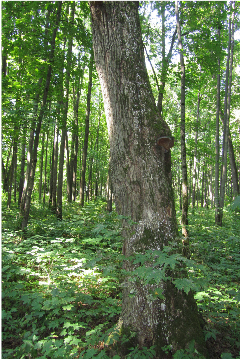
Рис. 4. Дерево клена с наклоном ствола и плодовыми телами трутовиков Fig. 4. Maple tree with the slope of the trunk and fruit bodies of polypore