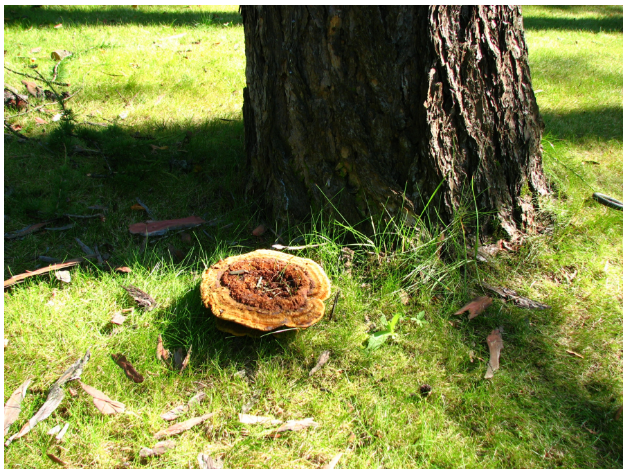
Рис. 2. Плодовое тело трутовика Швейница у комля лиственницы свидетельствует о поражении корневой системы дерева гнилью Fig. 2. The fruit body of the polypore of Shveynitsa in the larch clump indicates that the root system of the tree is affected by rot

Косвенными признаками, говорящими о возможном присутствии в стволе гнили, являются: