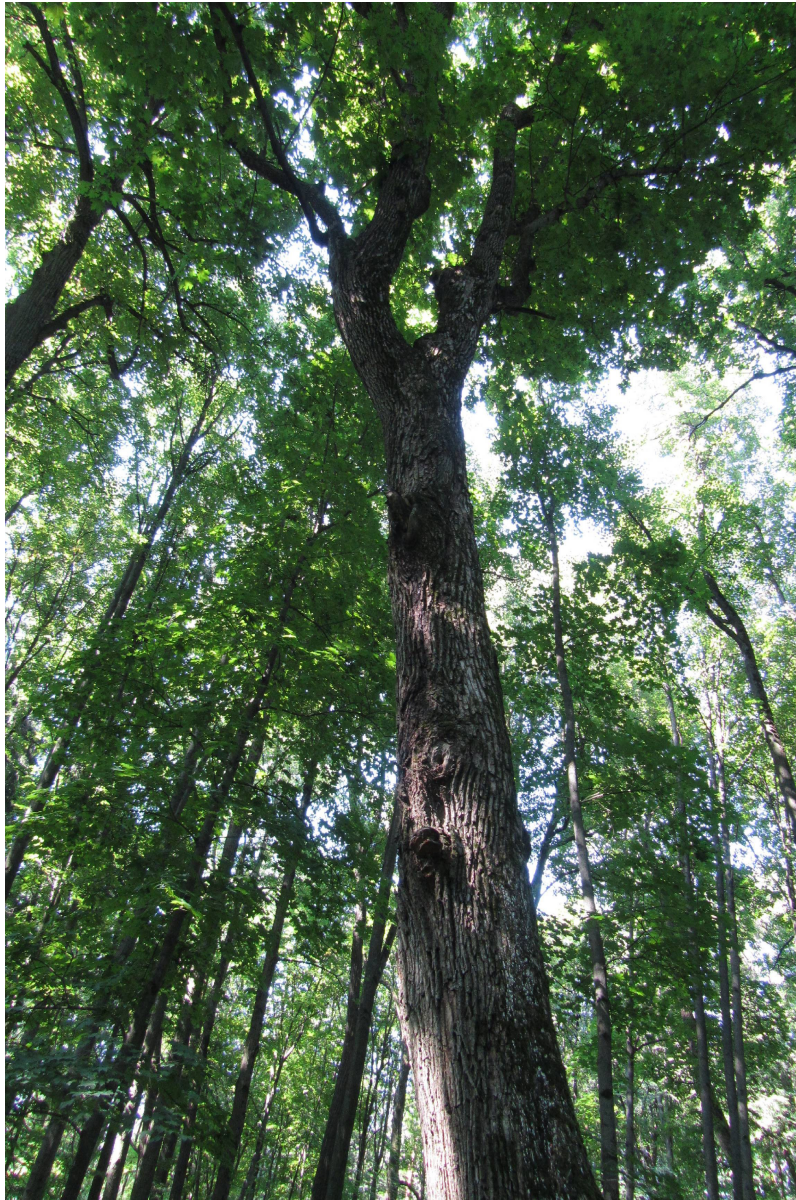
Рис. 6. Общий вид кроны у дерева клена, пораженного ядровой гнилью Fig. 6. General view of the crown of a maple tree affected by heart rot

В процессе полевых работ с помощью рулетки измерялась длина окружности каждого дерева. Далее отобранные керны упаковывались в бумажные пакеты, на которые наносился номер учетного дерева, обозначалась его порода, дата отбора керна и зафиксированная длина окружности. Керны поступали в лабораторию дендрохронологии Мытищинского филиала МГТУ им. Н. Э. Баумана, где проводилась их обработка. Для этого на основе длины окружности керна рассчитывали средний радиус ствола на высоте отбора керна. На отобранных кернах измерялась длина участков здоровой древесины, рассчитывался процент гнили.