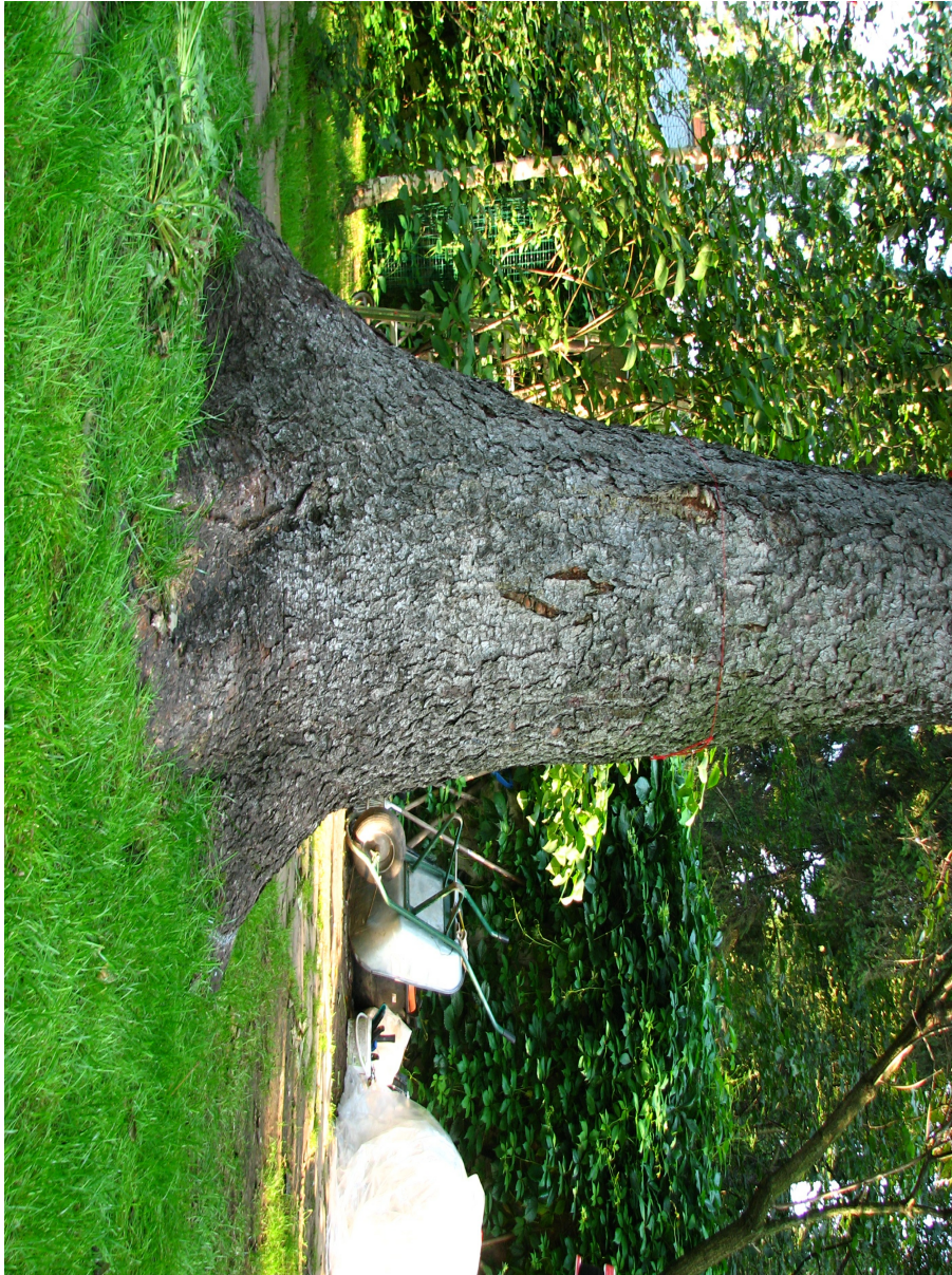
Рис. 1. Аномальное утолщение ствола ели в комлевой части свидетельствует о развитии ядровой гнили (вероятно, корневая губка)

Fig. 1. Abnormal thickening of the trunk of the spruce in the clump part indicates the development of heart rot (probably root sponge)