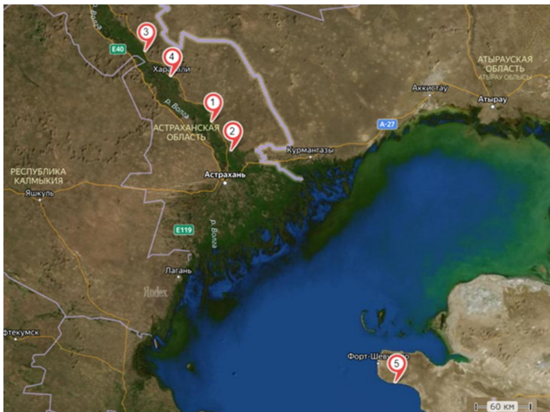
Рис. 1. Карта-схема мест отлова ужа водяного. Северный Прикаспий: 1 – Астраханская область, Красноярский район, пос. Комсомольский, с. Лапас; 2 – Астраханская область, Красноярский район, р. Ахтуба, пос. Белячий, с. Ясын-Сокан; 3 –

Отлов ужа водяного и лабораторные исследования велись на территории Северного (РФ, Астраханская область) и Восточного (Казахстан, Мангистауская область) Прикаспия (рис. 1). Все работы со змеями проводили в соответствии с «Международными рекомендациями по проведению медико-биологических исследований с использованием животных» (International Recommendations..., 2012). В исследованиях использовали только половозрелых змей. Объем материала и краткая характеристика мест отлова представлены в табл. 1.