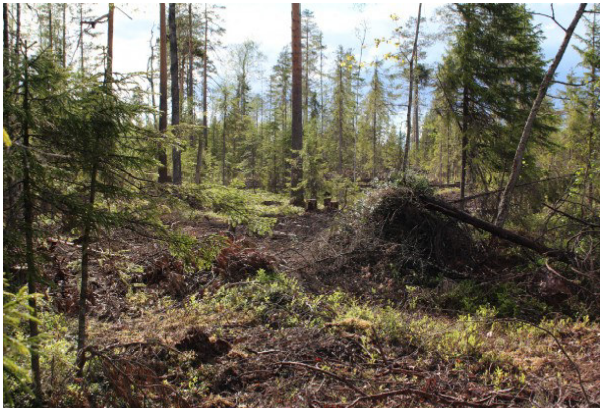
Рис. 5. Сплошная рубка с сохранением элементов исходного древостоя Fig. 5. Clear-cutting with preservation of original elements of the stand

перехода от сплошных рубок к несплошным и широкого внедрения различных методов сохранения мозаичности лесного ландшафта при сплошных рубках недостаточно внесения конкретных изменений в отдельные нормативные правовые акты (например, ограничить площадь деланки сплошной рубки до 10 га). Необходимы изменения, обеспечивающие устойчивое лесопользование в целом, частью которых будут изменения, касающиеся применения различных видов рубок и особенностей их проведения.