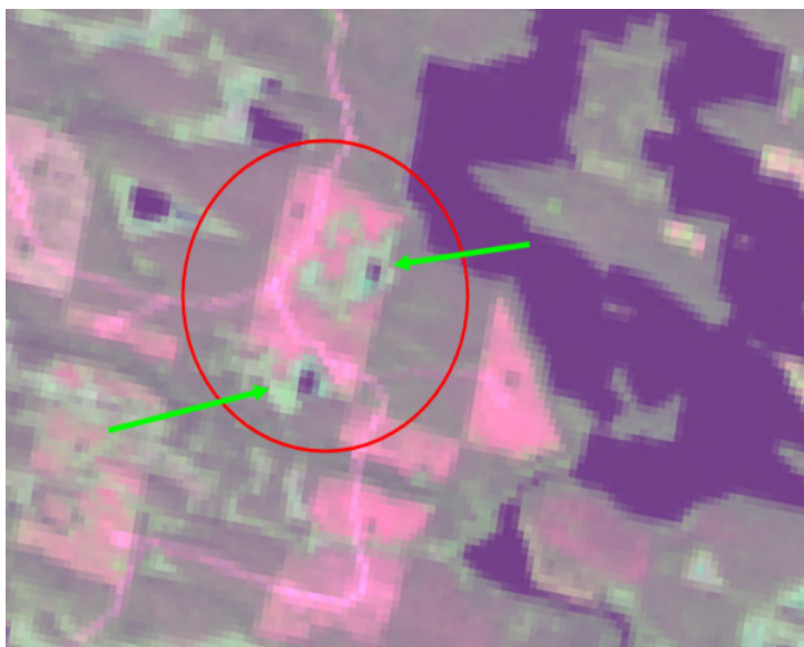
Рис. 3. Космический снимок делянки сплошной рубки с сохраненными ключевыми биотопами (указаны на снимке стрелками; снимок спутника Landsat, http://glovis.usgs.gov/ )