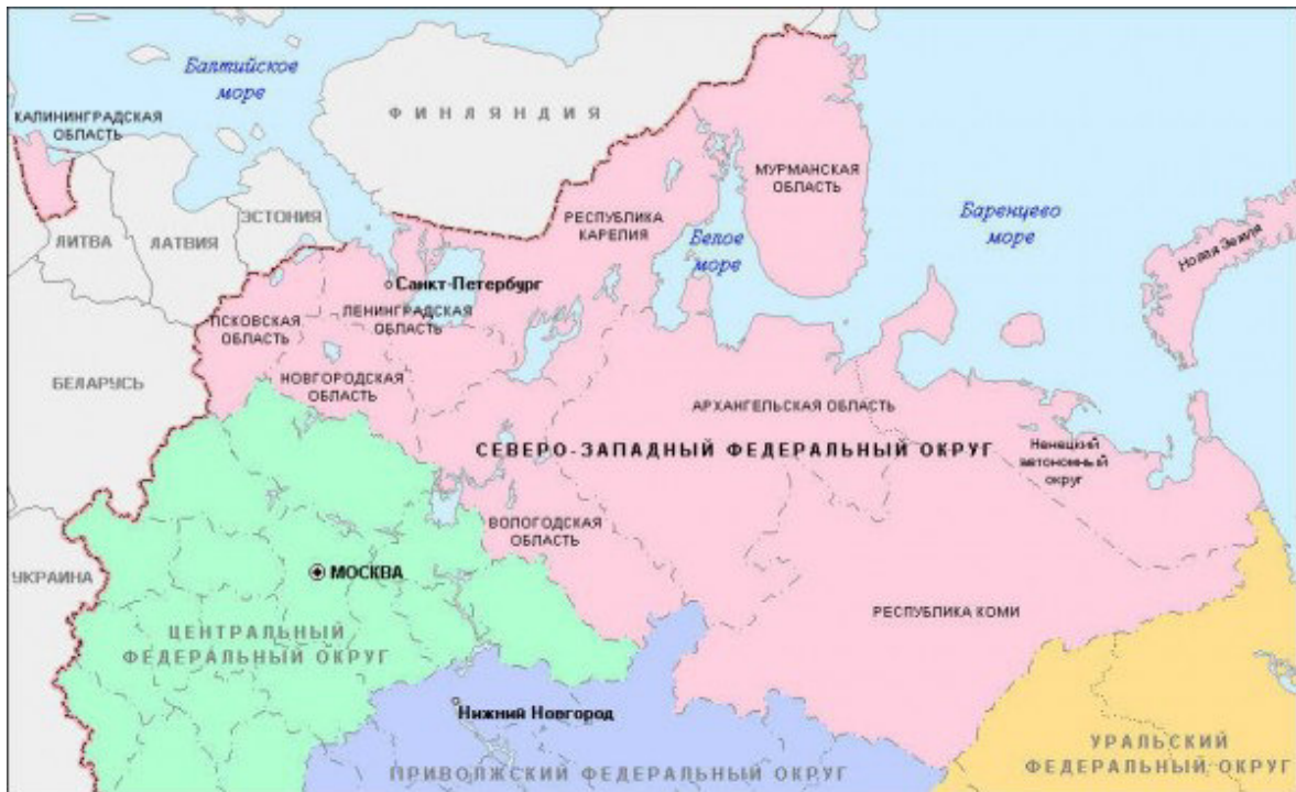
Рис. 1. Карта-схема Северо-Западного федерального округа РФ (Северо-Западный..., 2016а) Fig. 1. Schematic map of the North-West Federal District of Russia (North-West..., 2016a)

Лесопромышленный сектор является одним из ключевых в экономике региона. На территории СЗФО произрастает почти 60 % лесов европейской части России. Запас древесины – около 10 млрд м 3 . Здесь производится 30 % российских пиломатериалов, 40 % клееной фанеры, порядка 40 % деловой древесины, 50 % картона и 60 % бумаги (Северо-Западный..., 2016б).