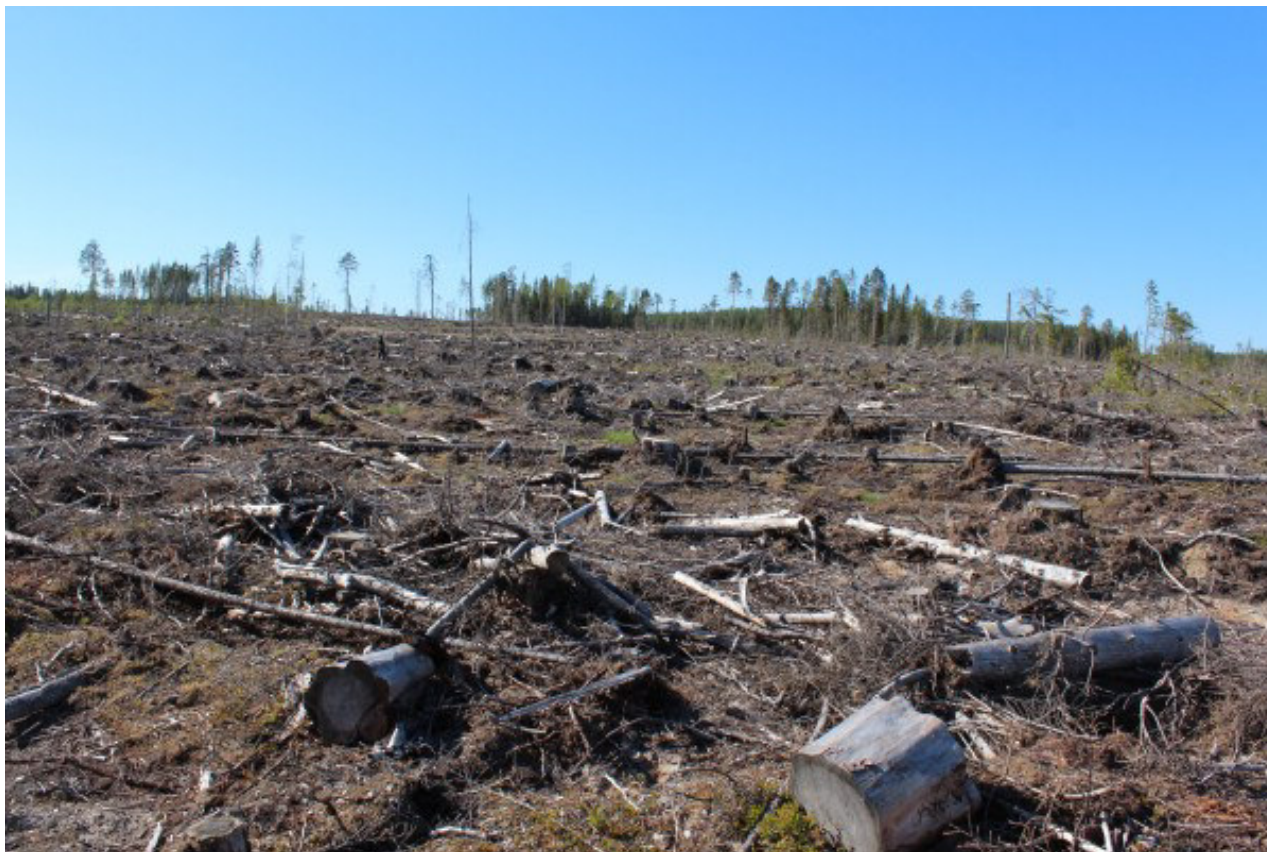
Рис. 4. Сплошная рубка большой площади без сохранения ключевых биотопов Fig. 4. Large clear-cut plot without preserving key habitats

Если проведение несплошных рубок невозможно, то рубки следует планировать так, чтобы после заготовки древесины лесопользователи оставили за собой территорию с как можно менее преобразованной лесной средой, способной наилучшим образом восстановиться естественным образом (рис. 5). Для этого необходимо принимать специальные меры по сохранению лесной среды и мозаичности лесного ландшафта. Надо стараться сохранить как можно больше элементов исходного леса, которые позволят уменьшить степень изменения лесной среды и степень нарушения почвенного покрова (поскольку каждое оставленное на корню дерево уменьшает количество проходов техники и ее нагрузку на почву). Для таких условий вполне подходящим компромиссом были бы условно-сплошные рубки.