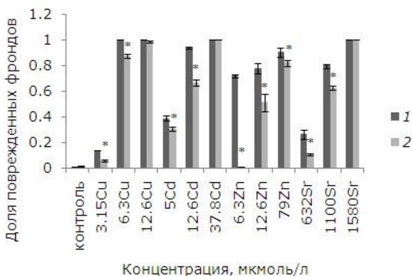
Рис. 2. Влияние 24-эпибрассинолида (эпб) на долю поврежденных фрондов ряски малой при избытке меди, кадмия, цинка и стронция. * – отличия достоверны у растений, предобработанных 24-эпибрассинолидом, по сравнению с растениями без предобработки ( p \leq 0.05 ), критерий Манна – Уитни

Поврежденность фрондов зависит от концентрации тяжелых металлов. В контроле доля растений с хлорозами и некрозами не превышала 1 %. При воздействии на ряску 3.15 мкмоль/л меди она возросла до 14 %, при 3.15 и 6.3 мкмоль/л составила 100 %. После предобработки ЭПБ уровень повреждений снизился, но не для всех концентраций металла (рис. 2). При высоких концентрациях меди, кадмия и стронция, когда повреждены все фронды, предобработка ЭПБ не оказала положительного эффекта. При воздействии 5, 12.6 мкмоль/л кадмия предобработка ЭПБ позволила снизить долю поврежденных фрондов с 39 до 31 % и с 94 до 67 % соответственно. Растений без видимых изменений стало больше в экспериментах с 3.15, 6.3 мкмоль/л Cu ( p \leq 0.05 ). При воздействии низкой и средней концентраций стронция доля поврежденных фрондов снизилась благодаря ЭПБ в 2.3 и 1.3 раза соответственно. Из всех рассматриваемых тяжелых металлов лучше всего ЭПБ снизил токсичность цинка: уменьшение доли фрондов с некрозами и хлорозами произошло для всех концентраций.