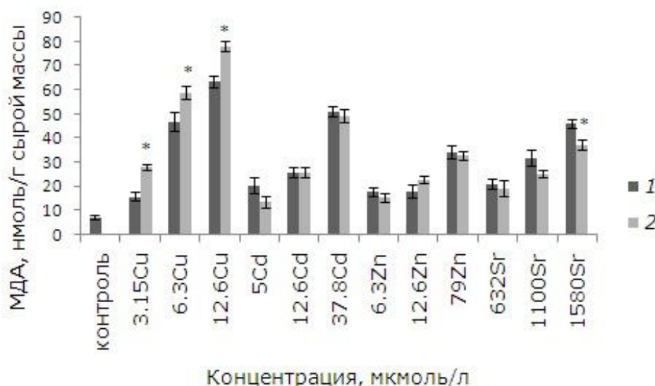
Рис. 4. Влияние 24-эпибрассинолида (эпб) на содержание малонового диальдегида (МДА) при избытке меди, кадмия, цинка и стронция. * – отличия достоверны у растений, предобработанных 24-эпибрассинолидом, по сравнению с растениями без предобработки ( p \leq 0.05 ), критерий Манна – Уитни Fig. 4. The effect of 24-epibrassinolide (EPB) on the content of malondialdehyde (MDA) with an excess of copper, cadmium, zinc and strontium. * – the differences are significant in plants pretreated with 24-epibrassinolide compared to Lemna minor L. without pretreatment ( p \leq 0.05 ), Mann – Whitney's test