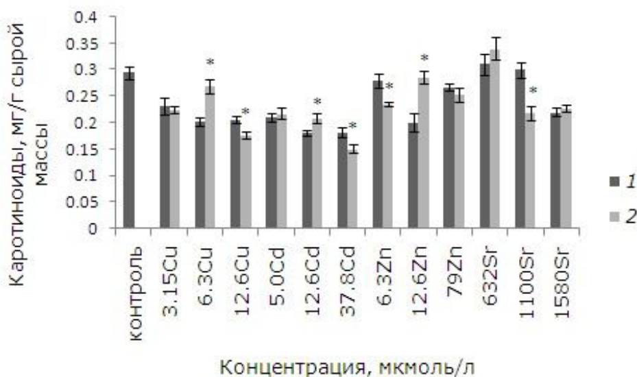
Рис. 7. Влияние 24-эпибрасинолида (эпб) на содержание каротиноидов при избытке меди, кадмия, цинка и стронция. * – отличия достоверны у растений, предобработанных 24-эпибрасинолидом, по сравнению с растениями без предобработки ( p \leq 0.05 ), критерий Стьюдента