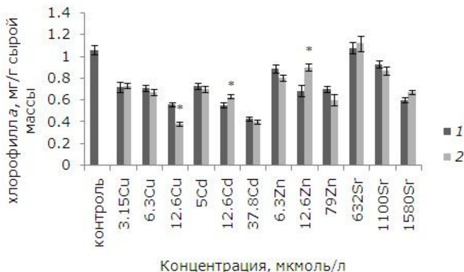
Рис. 5. Влияние 24-эпибрасинолида (эпб) на содержание хлорофилла a при избытке меди, кадмия, цинка и стронция. * – отличия достоверны у растений, предобработанных 24-эпибрасинолидом, по сравнению с растениями без предобработки ( p \leq 0.05 ), критерий Стьюдента