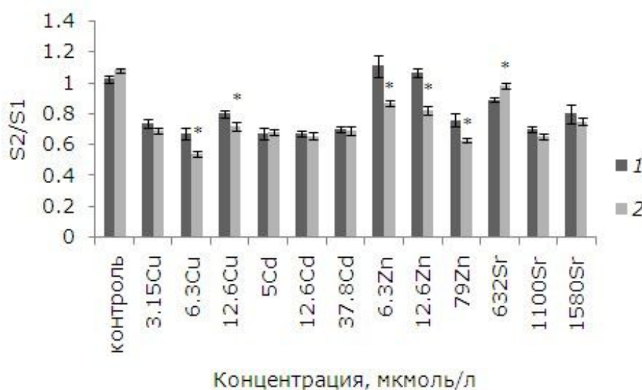
Рис. 3. Влияние 24-эпибрасинолида (эпб) на площадь фрондов ряски малой при избытке меди, кадмия, цинка и стронция. S2/S1 – отношение площадей фрондов; S1 – первоначальная площадь фрондов, мм; S2 – площадь фрондов через 7 дней, мм. * – отличия достоверны у растений, предобработанных 24-эпибрасинолидом, по сравнению с растениями без предобработки ( p \leq 0.05 ), критерий Стьюдента

поэтому средняя площадь теперь близка к первоначальной. Предварительная обработка ЭПБ перед воздействием 632 мкмоль/л стронция способствовала увеличению площади фрондов относительно необработанных растений. Применение фитогормонов привело к повышению удельной скорости роста при воздействии меди, цинка (6.3, 12.6 мкмоль/л), появилось больше дочерних растений, меньших по размерам, но их средняя площадь уменьшилась (рис. 3).