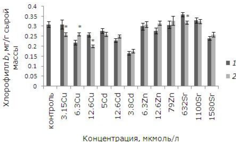
Рис. 6. Влияние 24-эпибрасинолида (эпб) на содержание хлорофилла b при избытке меди, кадмия, цинка и стронция. * – отличия достоверны у растений, предобработанных 24-эпибрасинолидом, по сравнению с растениями без предобработки ( p \leq 0.05 ), критерий Стьюдента