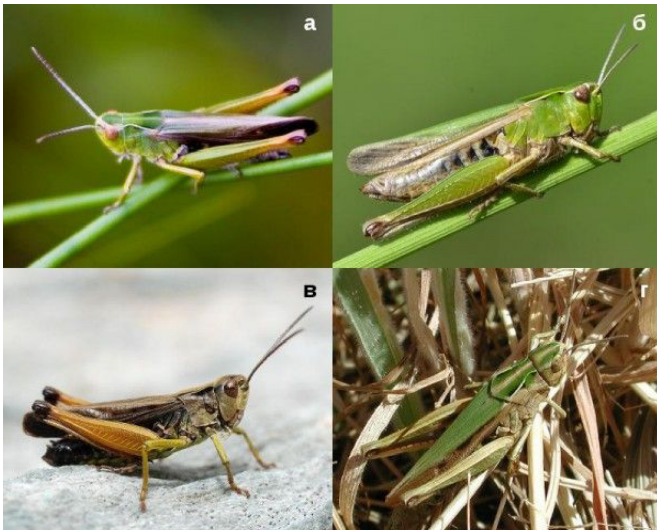
Рис. 1. Цветовые формы Omocestus viridulus : а – самец f. viridis; б – самка f. viridis; в – самец f. rubiginosa; г – самка f. hyalosuperficies