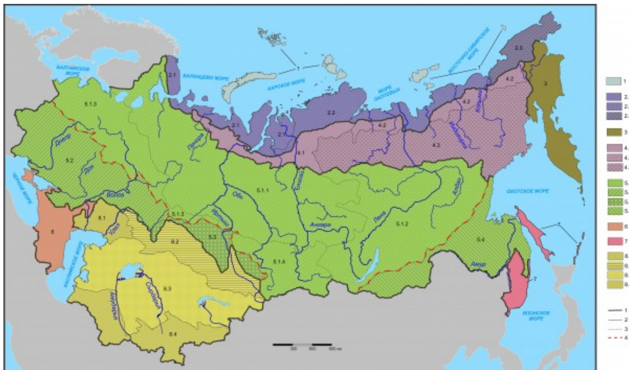
Рис. 1. Флоро-фаунистическое районирование Северной Евразии.

Характеристики таксонов см. выше в тексте классификации; границы: 1 – подобластей, 2 – провинций, 3 – округов, 4 – максимальной диагональности