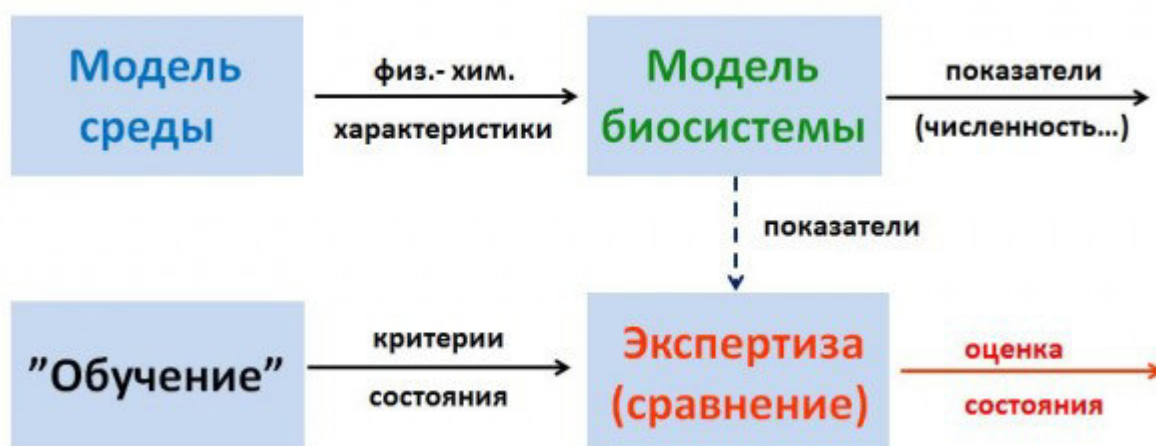
Рис. 2. Схема экспертной системы Fig. 2. Scheme of expert system

Экспертная система включает в себя два главных компонента – блоки модели объекта и блоки экспертной оценки состояния объекта. Сопоставляя результаты моделирования с заранее выработанными критериями «нормы» и «нарушения», получаем оценку текущего состояния зоопланктона (рис. 2).