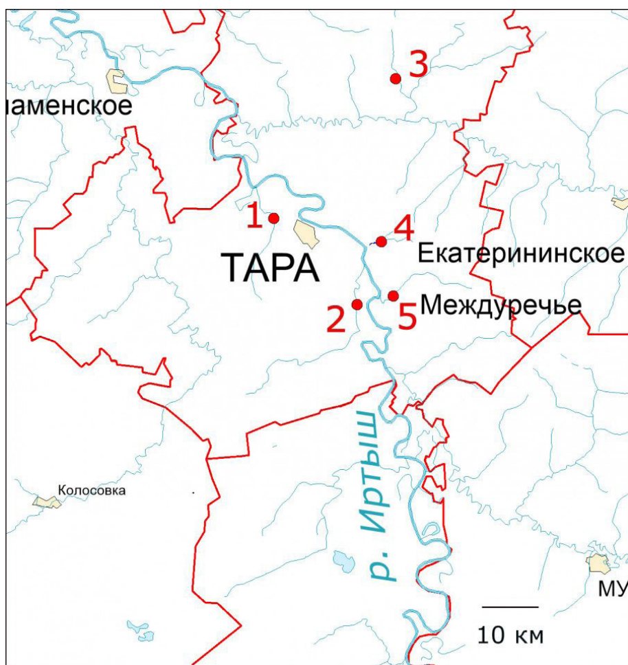
Рис. 1. Карта-схема мест отбора проб в реках лесной зоны Омской области, сентябрь 2020 г. Точки отбора: 1 – р. Степановка (56°55'19''N 74°16'54''E); 2 – р. Ибейка (56°47'00''N 74°31'37''E); 3 – р. Каланзас (57°08'44''N 74°38'23''E); 4 – р. Абросимовка (56°53'05''N 74°35'51''E); 5 – р. Уразай (56°47'31''N 74°35'43''E).