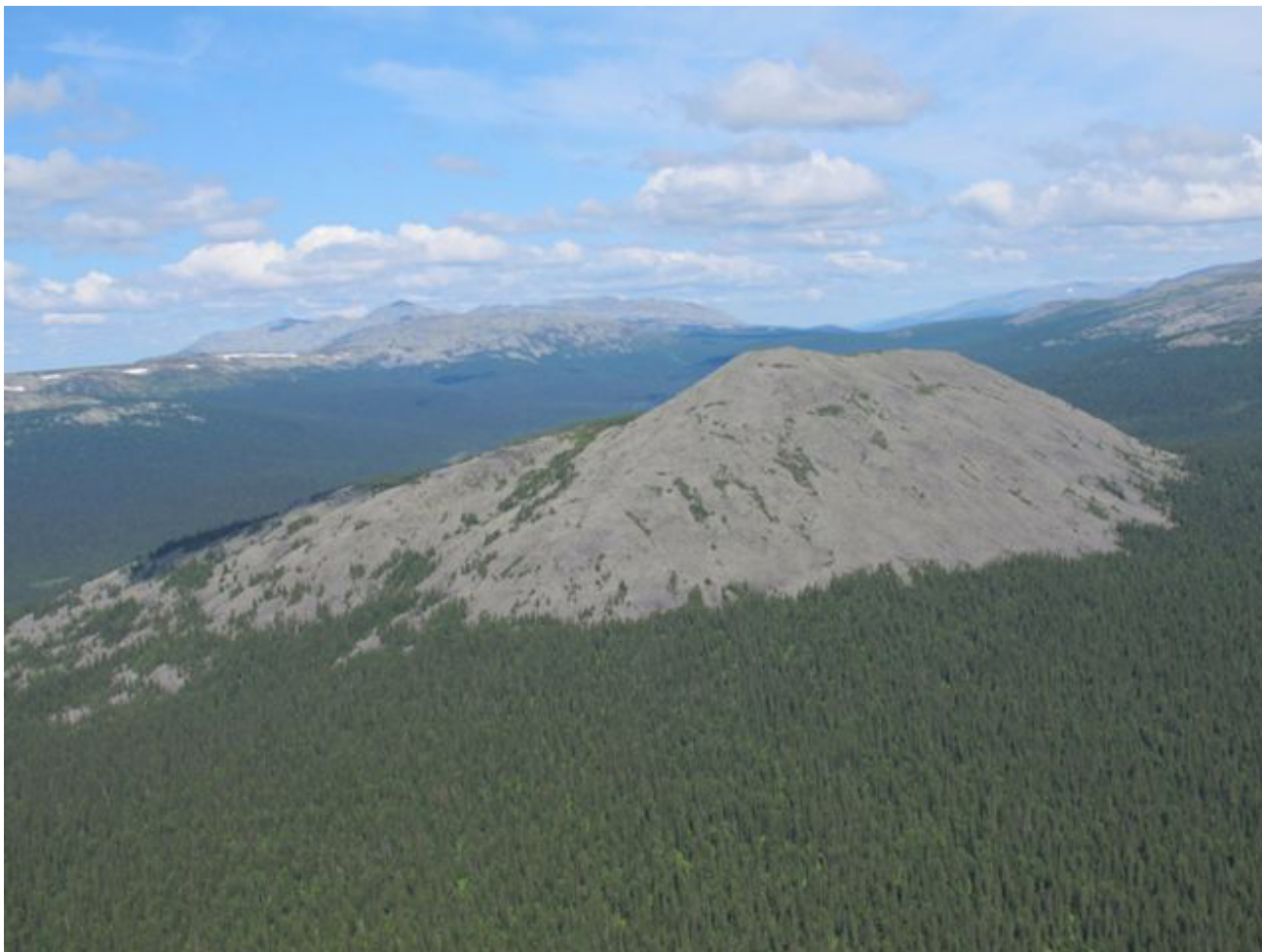
Рис. 3. Хребты Северного Урала (пример территории горно-водораздельного гидроландшафта) Fig. 3. Ridges of the Northern Urals (example of the territory of the mountain-watershed hydro-landscape)

Dyar, 1919, A. nigripes (Zetterstedt, 1838), A. pullatus (Coquillett, 1904), A. punctor (Kirby, 1837), Culiseta alaskaensis (Ludlow, 1906) и C. bergrothi (Edwards, 1921) (Панюкова, 2022). Из этого списка видов комаров эдификатор A. punctor , а видами-индикаторами служат редкие виды рода Culiseta : C. alaskaensis и C. bergrothi .