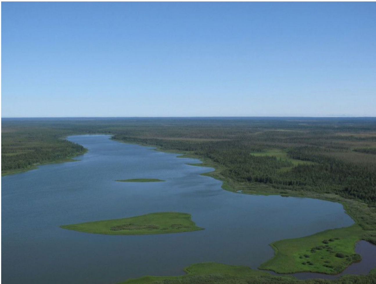
Рис. 5. Болотно-лесной комплекс (пример низменно-болотно-водораздельного гидроландшафта). Болото Океан

го таяния снега. При этом на болотах видовое разнообразие комаров ограничивается условиями высокой кислотности водной среды. Индикатором данной территории служит редкий вид комара Aedes nigrinus (Eckstein, 1918).