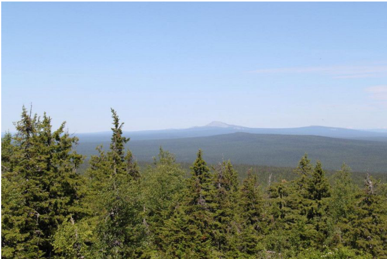
Рис. 4. Вид на долину р. Илыч, возвышенность Высокая Парма (пример предгорно-озерно-речного гидроландшафта)

данном гидроландшафте известно 22 вида комаров (Панюкова, Novakovskiy, 2021). К массовым отнесен A. punctor . Виды-индикаторы гидроландшафта – Aedes cantans (Meigen, 1818), A. cyprius Ludlow, 1920 и Culex torrentium Martini, 1925.