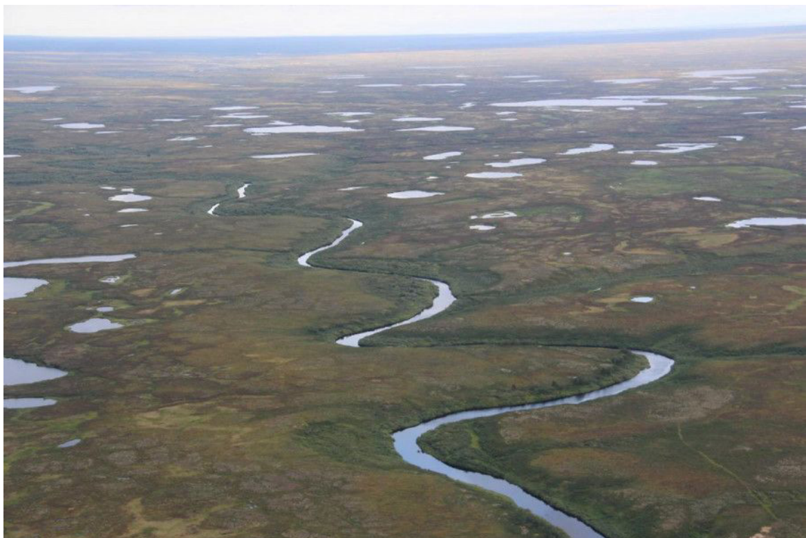
Рис. 7. Большеземельская тундра (низменно-болотно-озерный гидроландшафт) Fig. 7. Bolshezemelskaya tundra (lowland-swamp-lake hydro-landscape)