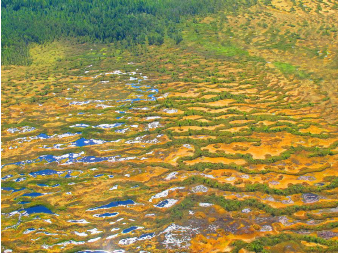
Рис. 6. Болотно-лесной комплекс низменно-болотно-междуречного гидроландшафта Fig. 6. Swamp-forest complex of lowland-swamp-interfluve hydro-landscape