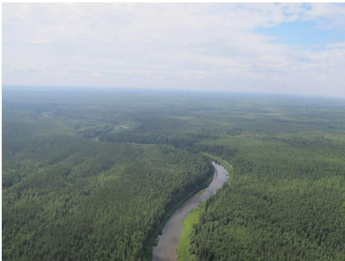
Рис. 8. Тиманский кряж (грядово-водораздельно-речной гидроландшафт) Fig. 8. Timan Ridge (ridge-watershed-river hydro-landscape)