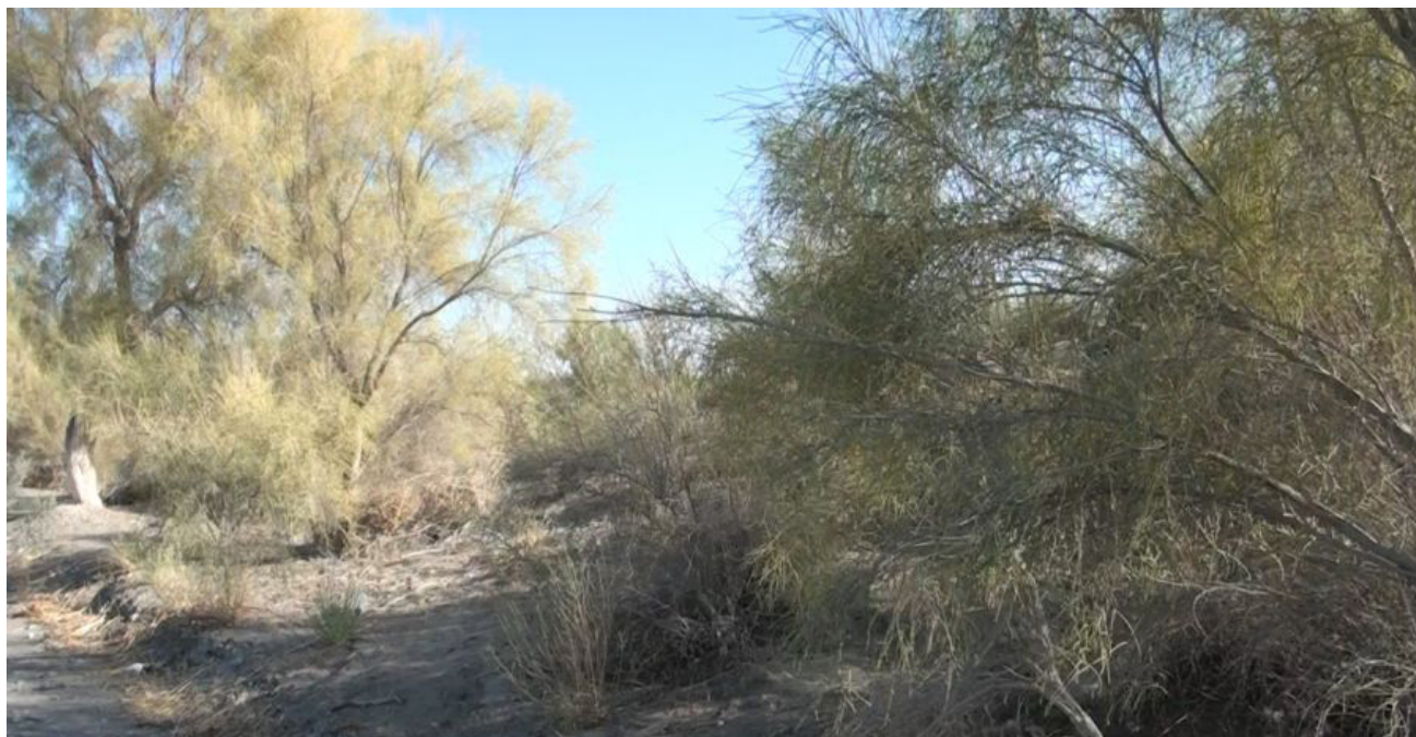
Рис. 5. Фитомелиоративные саксаульники

черного саксаула пригодны для производства уксусной кислоты и метилового спирта. Оба вида саксаула в зимнее время используются в качестве корма для верблюдов и овец. Широко применяется при закреплении подвижных песков. Во время наблюдений в Юго-Восточной части Каракумов мы увидели множество фитомелиоративных саксаульников (рис. 5).