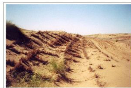
На крутых склонах устанавливается сетчатые вертикальные камышовые механические защиты размером 1 х 1 м., на ровных спланированных участках 3 (4) х 3 (4) м.