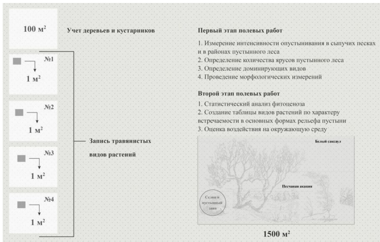
Рис. 4. Этапы проведения полевых работ Fig. 4. Stages of field work

пустыни является определение количества ярусов и состава доминирующих видов, а также проведение морфологических измерений. Описания фитоценоза проводится на пробной площади размером 1500 м 2 (30 × 50 м), в пределах которой закладывается 1 площадка размером 100 м 2 (для учета деревьев и кустарников) и 3–5 площадок размером 1 м 2 (для учета травянистых растений). Второй этап связан со статистическим анализом полученных данных и оценкой воздействия фитоценоза пустыни на окружающую среду (рис. 4).