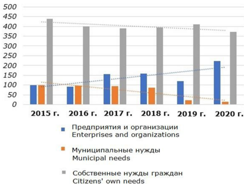
Рис. 2. Динамика объема древесины, проданной на корню, тыс. м 3 /год Fig. 2. Dynamics of the volume of sale of standing timber, thousand m 3 /year

а также внести изменения в процесс сбора статистических данных.