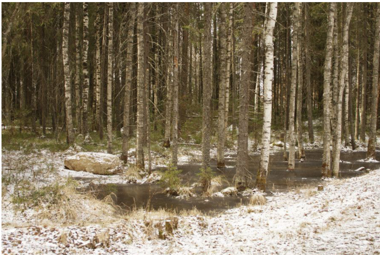
Рис. 3. Модельный водоем в период весеннего похолодания (12.05.2011), развитие личинок Aedes communis (De Geer, 1776) подо льдом

В отдельные годы исследований наблюдали влияние весенних заморозков на личинок изучаемого вида, которые начали свое развитие в предшествовавшую похолоданию оттепель. Так, во второй декаде мая 2011 г. весенние заморозки привели к образованию на поверхности водоема корки льда (рис. 3). Погибли только вмерзшие в лед личинки A. communis в крайних участках водоема. Большинство личинок сохранило жизнеспособность, они медленно двигались подо льдом. В апреле 2021 г. (30.04) вновь наблюдали развитие личинок первых возрастов A. communis подо льдом при температуре воды 2 °С.