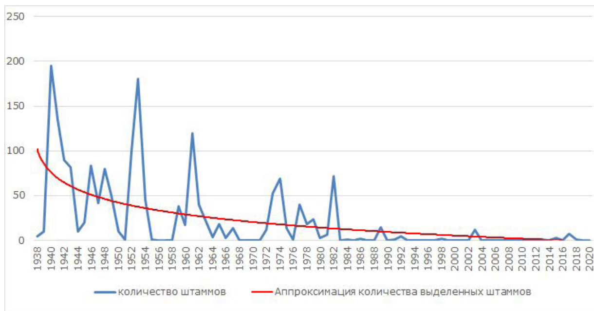
Рис. 1. Эпизоотическая активность природного очага туляремии в Ставропольском крае с 1938 по 2020 г.

Эпизоотические проявления среди грызунов имеют циклический характер (рис. 1) и характеризуются сменой интенсивных эпизоотий межэпизоотическими периодами.