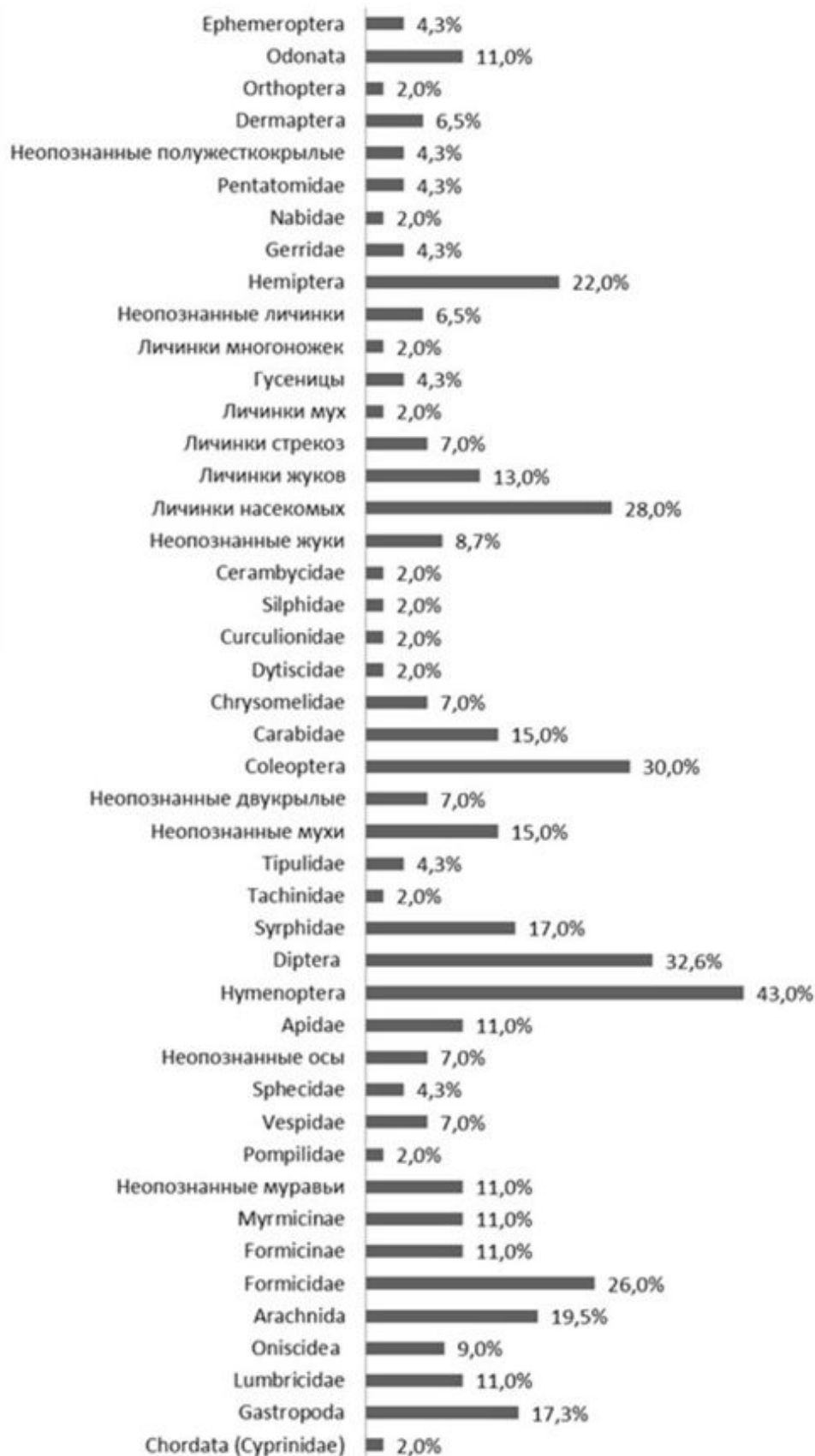
Рис. 1. Встречаемость различных видов корма в желудках озерной лягушки Fig. 1. The occurrence of different types of food in the stomachs of the Pelophylax ridibundus